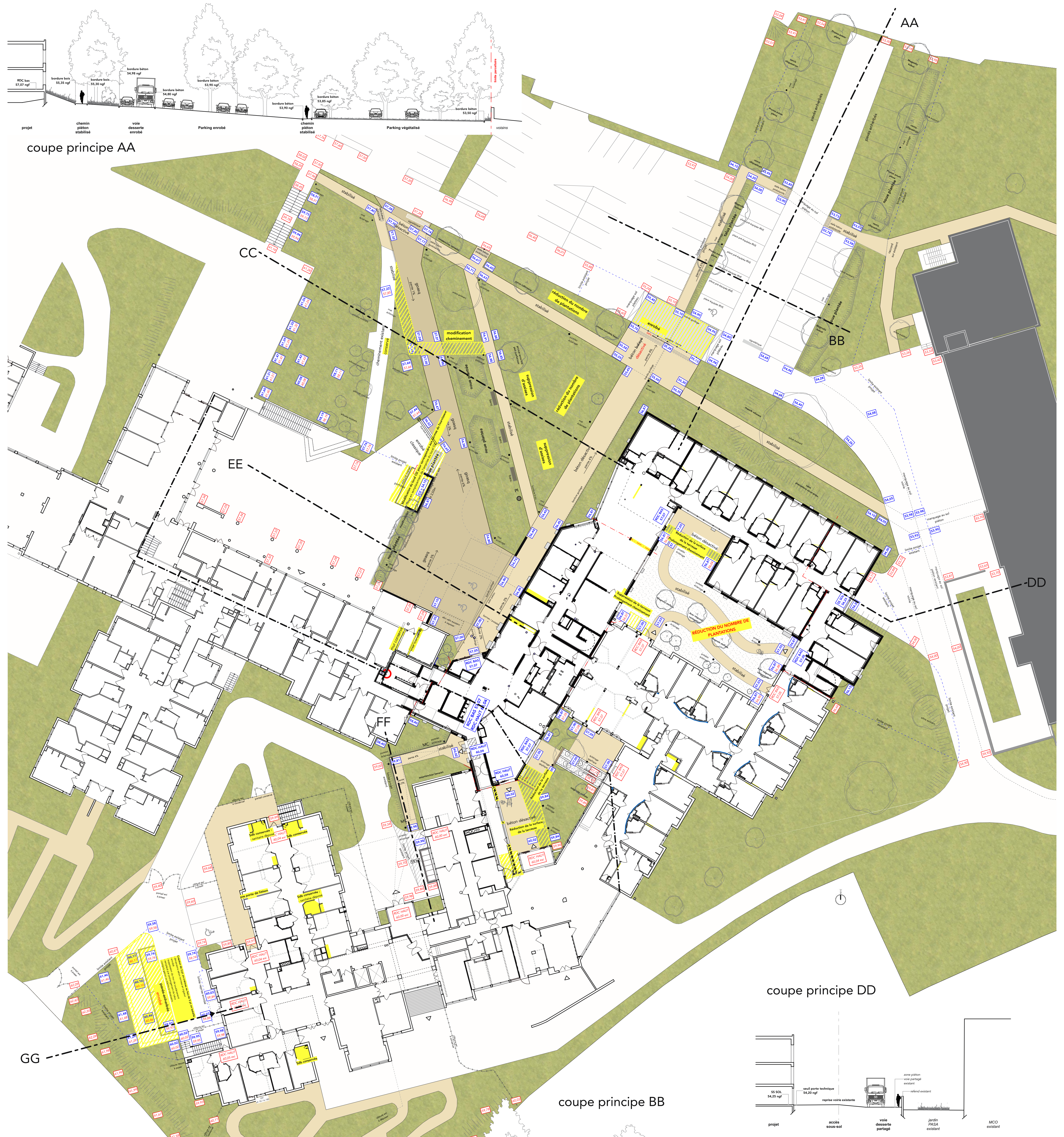
coupe principe AA